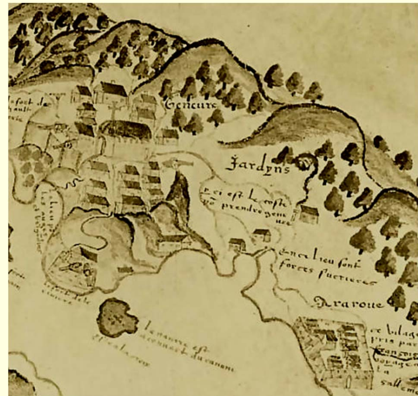
"Le vrai pourtraict de Geneure et du Cap de Frie", Jacques de Vau de Claye, 1579 (detalhe do Centro do Rio de Janeiro e São Cristóvão)