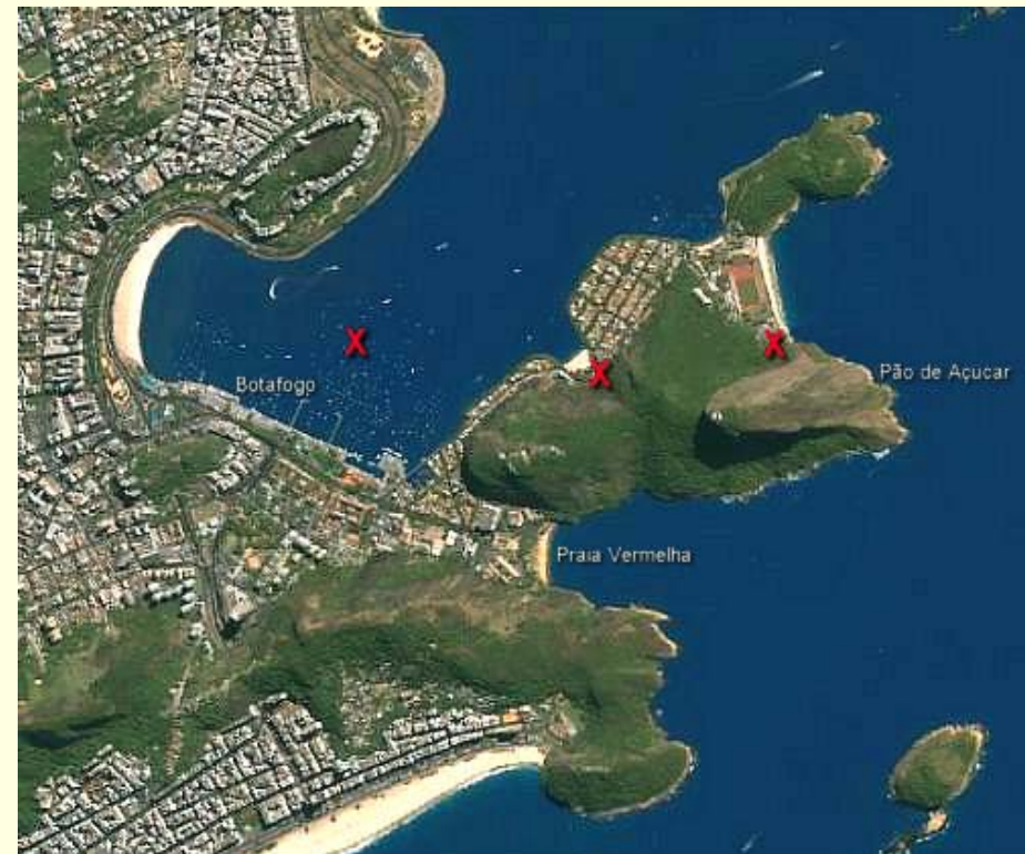
Ilustração simulando o mapa do tesouro francês, do séc. 16, na Baía de Guanabara