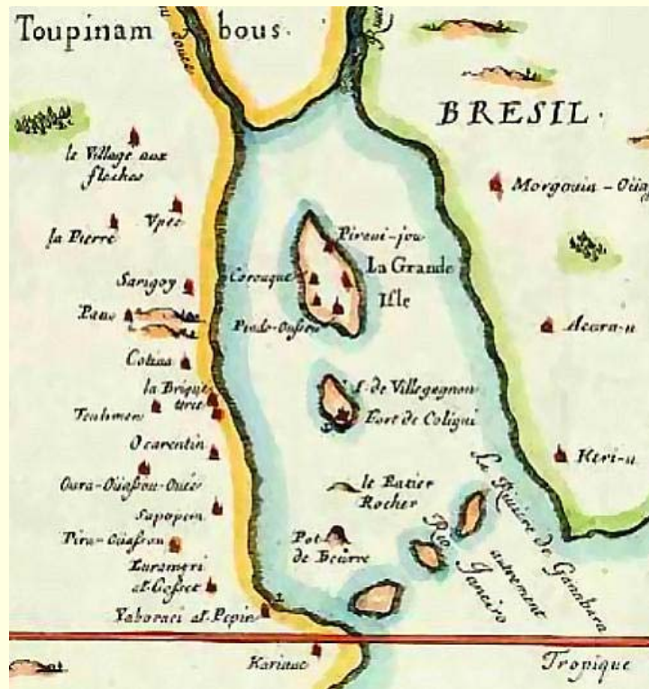
"Plan de la baye et de la ville de Rio Janeiro",